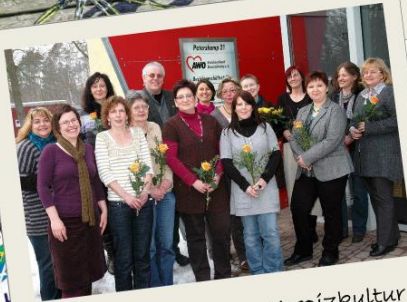
Palliativ-Kompetenz, Hospizkultur und Sterbebegleitung in den stationären Einrichtungen der Altenhilfe