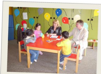
Seesener Entwicklungsscreening und Entwicklungsberatung - SEEM 0-6