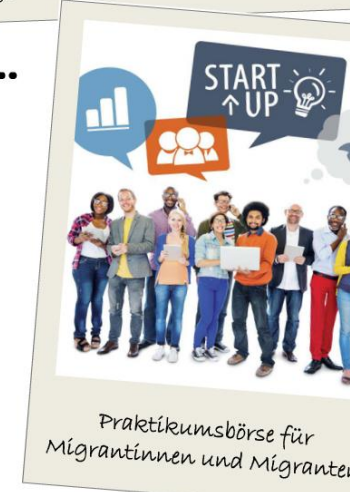
Praktikumsbörse für Migrantinnen und Migranten