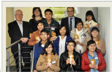
Vietnamesische Auszubildende zur Pflegefachkraft